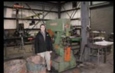
NEW JERSEY IRON WORKS Jackson, NJ Model Peddiworker 1100 Installed 1990

Lo Que Cuenta Es Lo De Dentro — Esa es la DIFERENCIA Peddinghaus