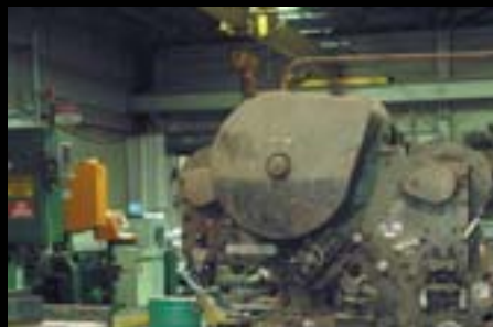
KOENIG IRON WORKS Brooklyn, NY Model 210A/20 Installed 1958