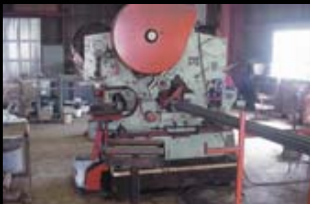
JOHN MALTESE IRON WORKS N. Brunswick, NJ Model 210/20 Installed 1961